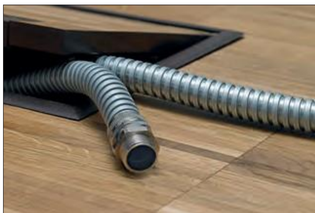
HelaGuard SC Galvanisert stålslange.